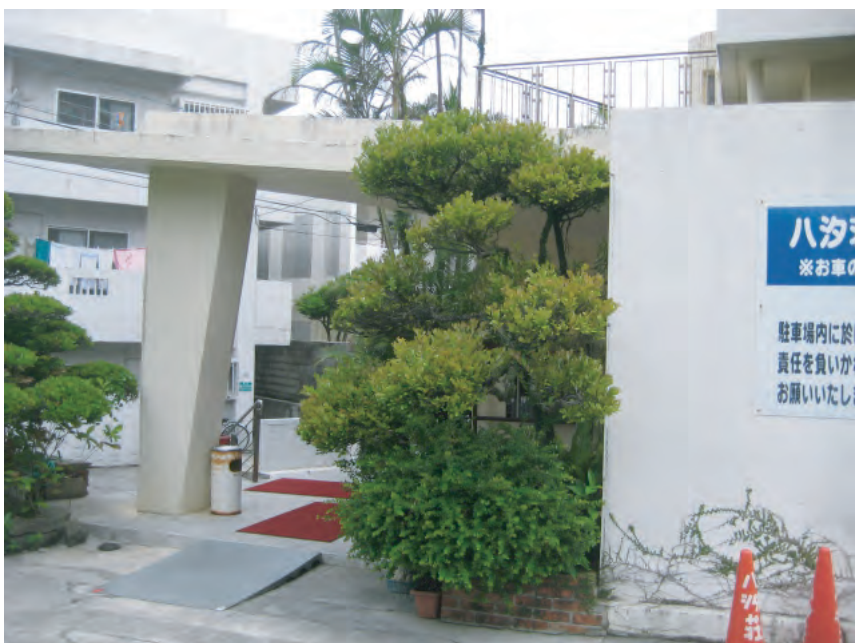
入口部分：③リュウキュウコクタン H（高さ）：3m C（幹周）：0.45m