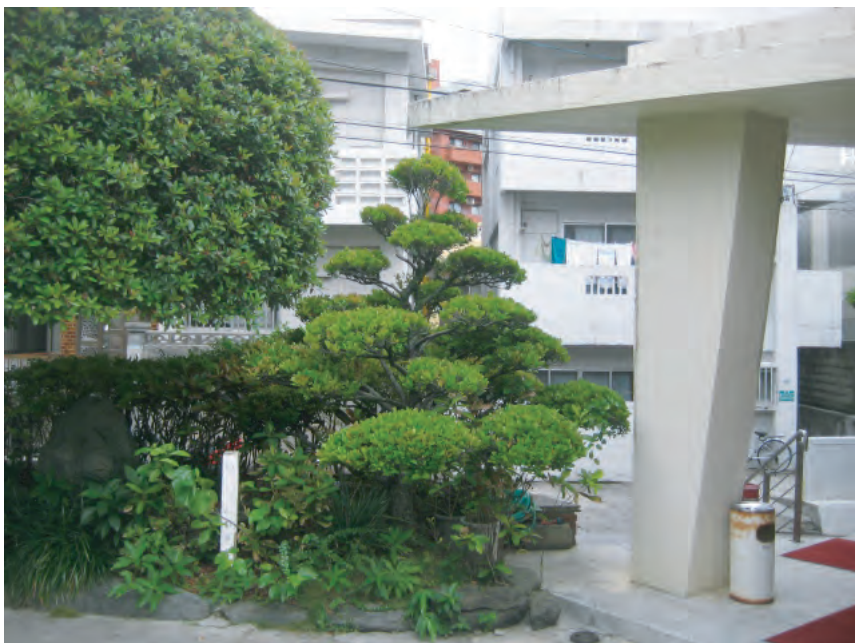
入口部分：②リュウキュウコクタン H（高さ）：2.5m C（幹周）：0.35m