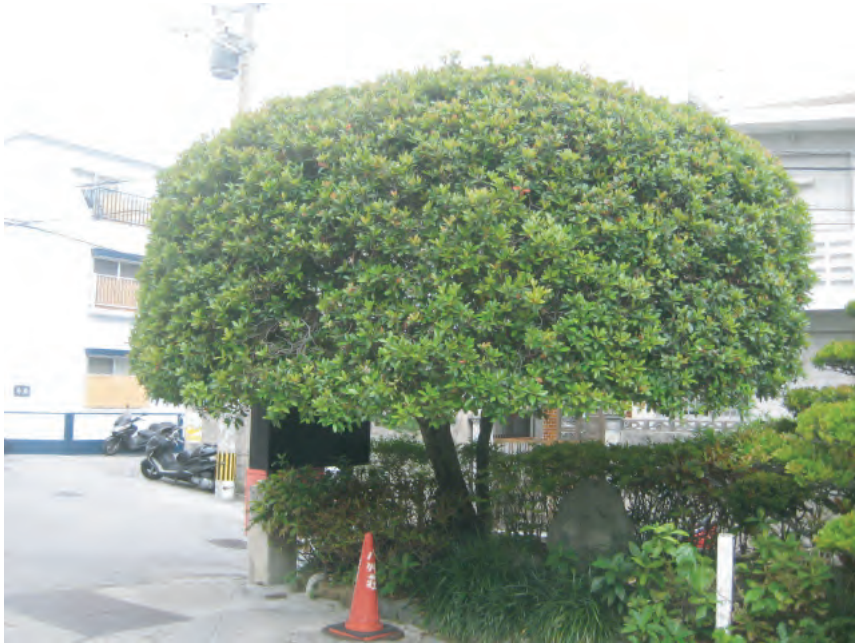
入口部分：①シャリンバイ H（高さ）：5m C（幹周）：0.5m