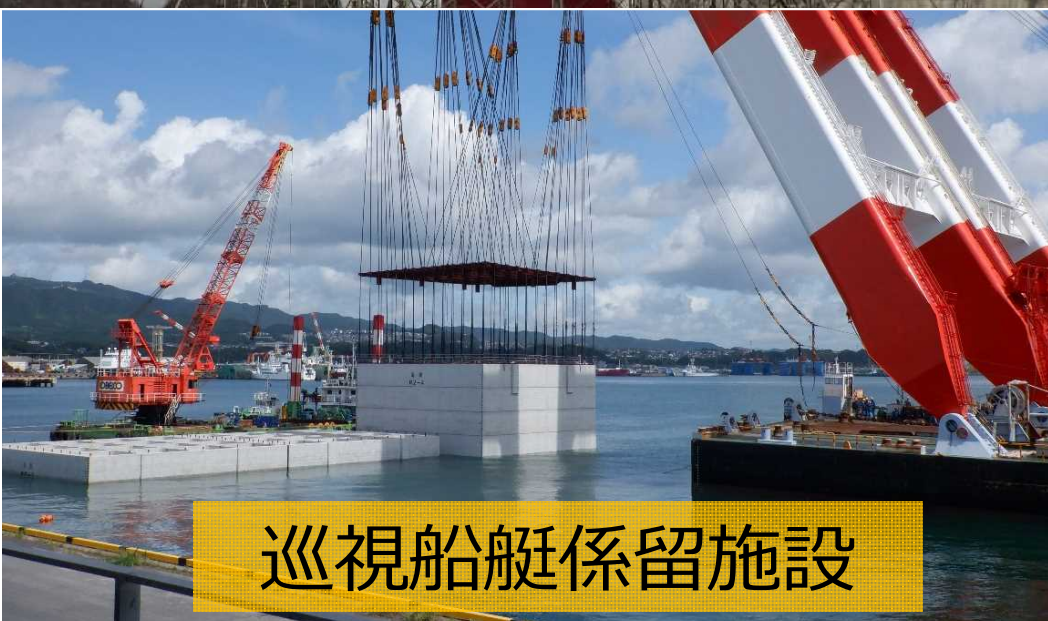
巡視船艇係留施設