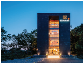
p36 / p104-105