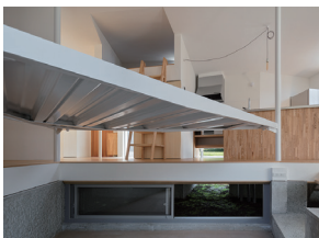
p25 / p82-83

床と大地の余地 江上史恭 FUMI EGAMI ARCHITECTS・九州産業 大学