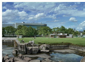
p34 / p100-101 © 楠瀬友将

久留米市中央公園 Park-PFI プロジェクト_KURUMERU 馬場正尊・小倉畑昂祐・ 市江龍之介 OpenA / ICE/ichie architects