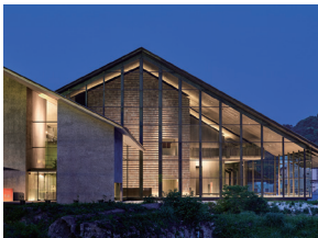
p10 / p52-53 © 阿野太一