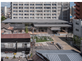
p12 / p56-57

別府市街地活性化プロジェクト アマネク別府ゆらり/ アマネクイン別府 / 旧エルザ 神本豊秋 (株) 再生建築研究所