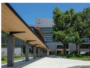
p42 / p116-117