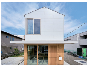
p27 / p86-87