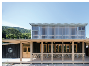
p32 / p96-97