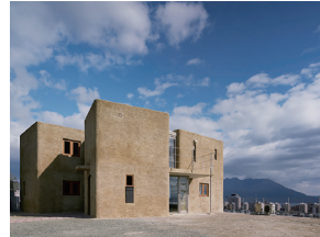
p16 / p64-65 © 阿野太一