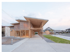
p35 / p102-103 © YASHIRO PHOTO OFFICE

鶴川商店街周辺拠点施設 塩塚隆生・下村正樹 塩塚隆生アトリエ / 下村正樹建築 設計事務所