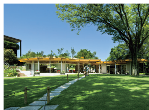
p33 / p98-99

福岡市植物園ボタニカル ライフスクエア 村上明生・重松正幸 アトリエサンカクスケール / 構造 FACTORY