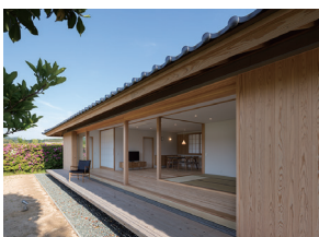
p24 / p80-81