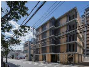
p37 / p106-107