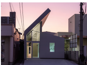
p14 / p60-61