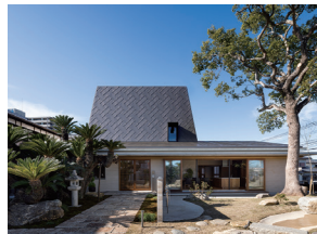
p30 / p92-93