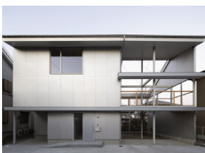
p28 / p88-89

久留米の庭と家 合屋統太・河内さつき・ ヤン＝ヤコブ・シュレーダー GOYA SCHRÖDER & associates