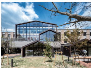
p38 / p108-109