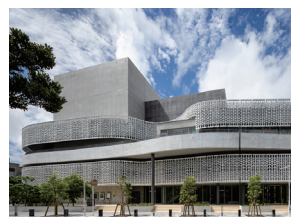
p21 / p74-75

那覇文化芸術劇場 なは一と 長谷川祥久・兒玉謙一郎・ 根路銘剛次・望月麻衣・角沢 聡子・岡本賢吾・香山壽夫 香山建築研究所 / 久米設計 / 根路銘 設計