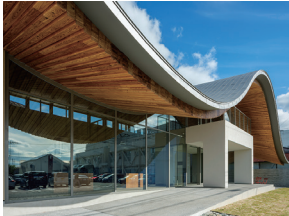
p9 / p50-51

d&i 大黒屋新社屋 佐々木翔・鈴江佑弥・円酒昂 (株) INTERMEDIA / 円酒構造設計