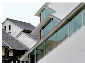
p31 / p94-95

宮前迎賓館 灯明殿 別館 高木正三郎・米満光平 設計+制作 / 建築巧房 一級建築士 事務所