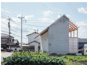
p26 / p84-85