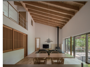
p15 / p62-63