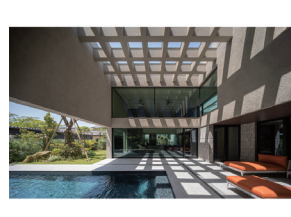
p17 / p66-67