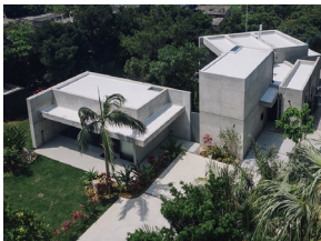
p11 / p54-55