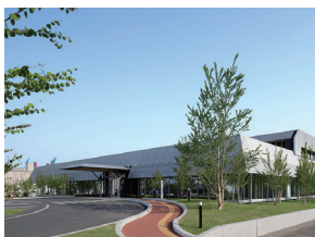
p40 / p112-113