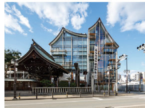
p18 / p68-69