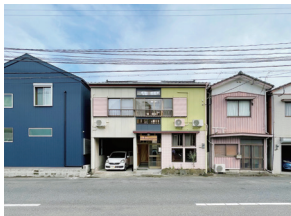
p23 / p78-79