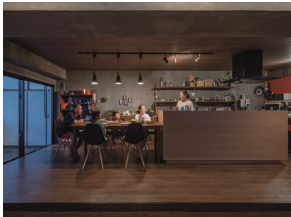
p22 / p76-77