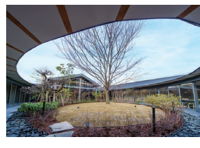
p19 / p70-71

やまや総本店 膳 / 白金小径 平瀬有人・平瀬祐子 早稲田大学・yHa architects