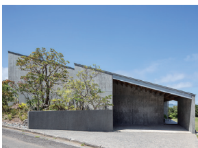
p13 / p58-59 © 石井紀久