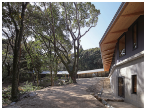
p39 / p110-111