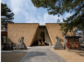
p8 / p48-49