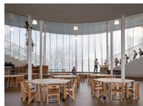
p20 / p72-73 © 中村絵

福岡ピノキオこども園 佐々木翔・円酒昂 (株) INTERMEDIA / 円酒構造設計