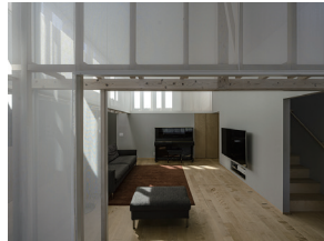
p29 / p90-91