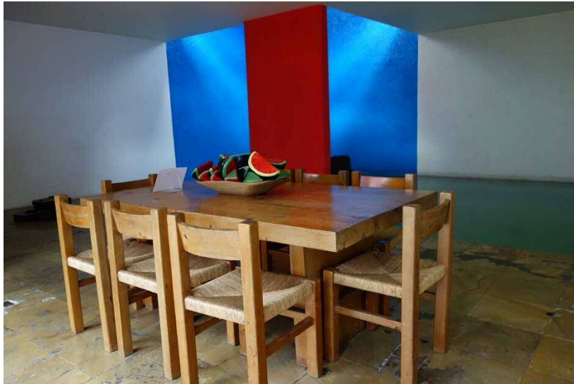
Casa Francisco Gilardi ヒラルディ邸