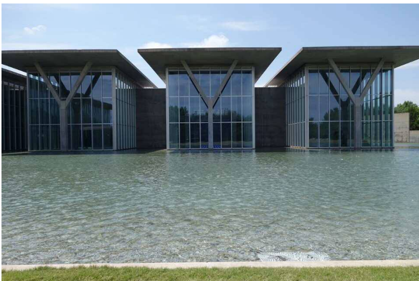
Modern Art Museum of Fort Worth フォートワース現代美術館