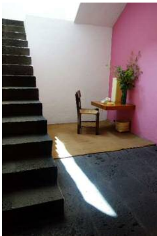
Casa Luis Barragán ルイス・バラ ガン邸