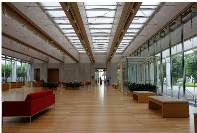
Kimbell Art Museum キンベル美術館