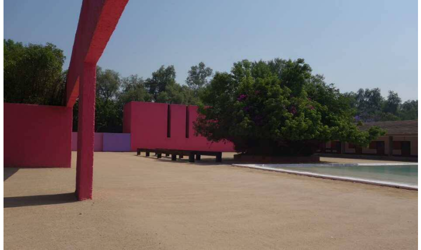
Cuadra San Cristóbal サン・クリストバル厩舎