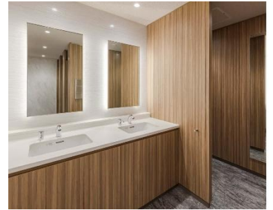
関電不動産西本町ビル(大阪府)