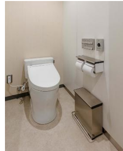
兜町第1平和ビル(東京都)